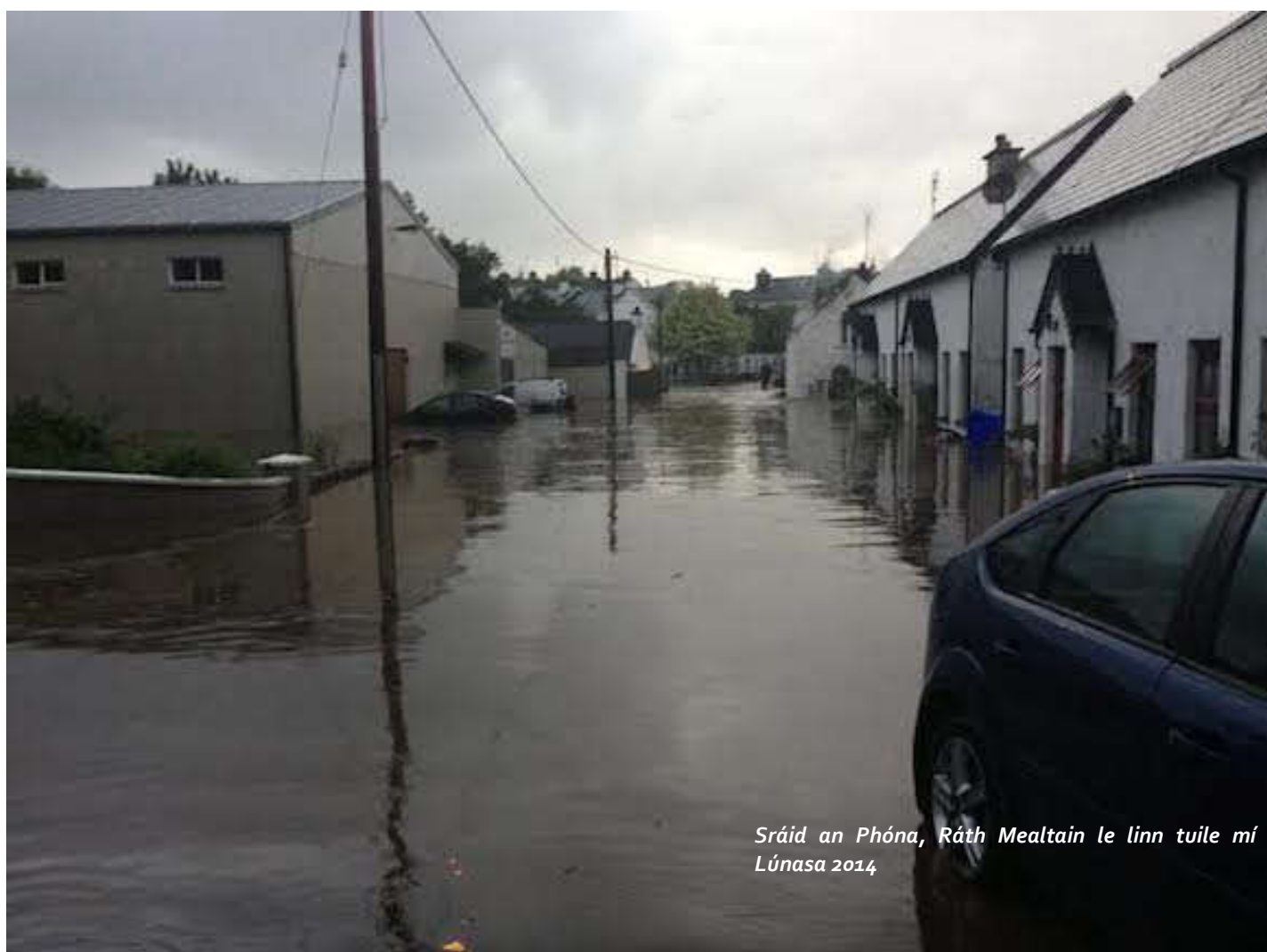
Sráid an Phóna, Ráth Mealtain le linn tuile mí Lúnasa 2014

Choimisiúnaigh Comhairle Contae Dhún na nGall ByrneLooby i mBealtaine 2021, chun Scéim Faoisimh Tuilte a fhorbairt agus a chur i bhfeidhm do Ráth Mealtain.