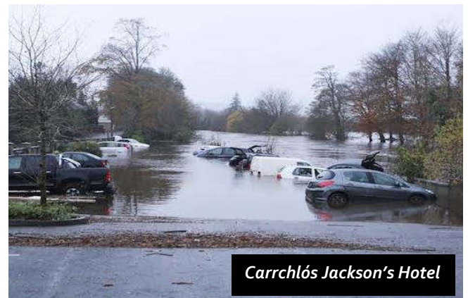
Carrchlós Jackson's Hotel

Cuireadh tús le forbairt na samhla hiodráláí ag baint úsáid as sonraí an tsuirbhé thopagrafaigh.