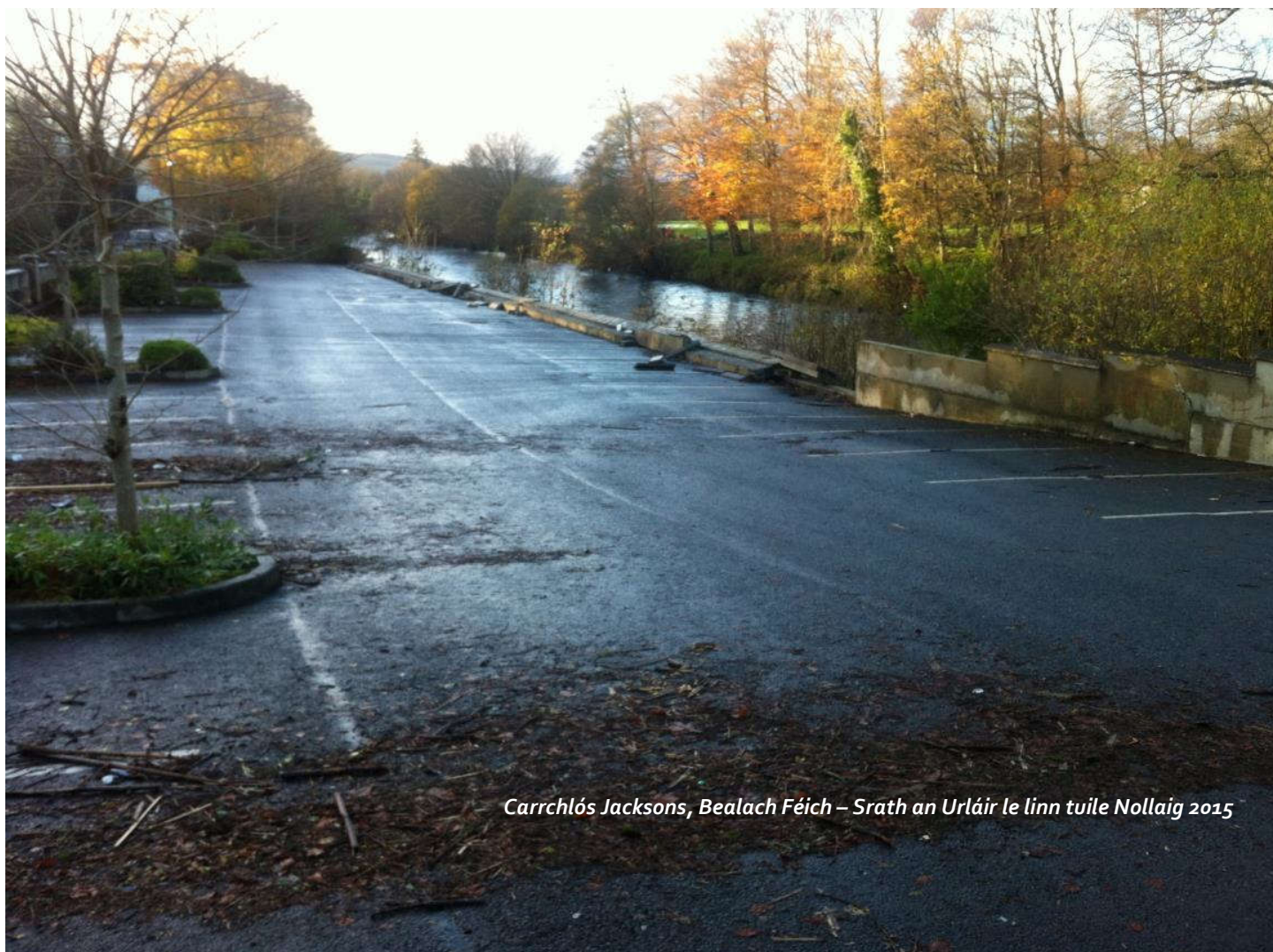
Carrchlós Jacksons, Bealach Féich – Srath an Urláir le linn tuile Nollaig 2015

Choimisiúnaigh Comhairle Contae Dhún na nGall ByrneLooby i mBealtaine 2021, chun Scéim Faoisimh Tuilte a fhorbairt agus a chur i bhfeidhm do Bhealach Féich – Shrath an Urláir.