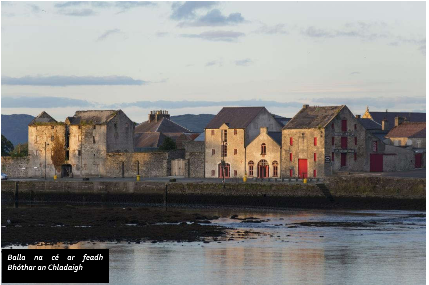
Balla na cé ar feadh Bhóthar an Chladaigh