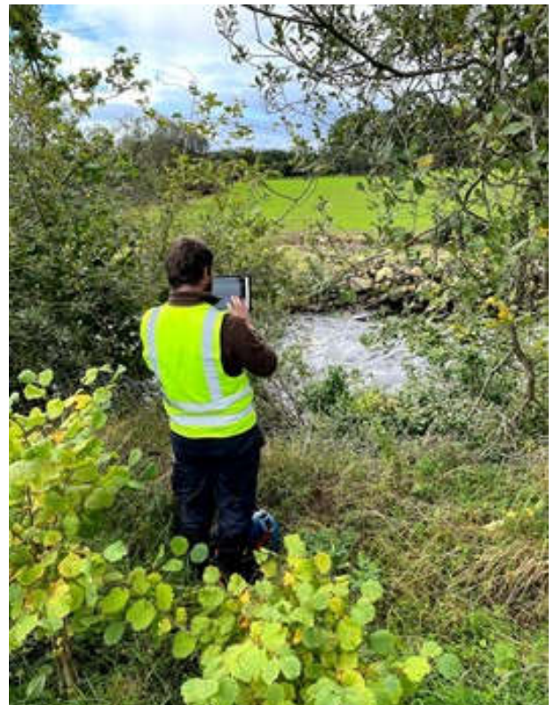
Oibreacha suirbhé comhshaoil, Ráth Mealtain Deireadh Fómhair 2021

Táthar ag déanamh suirbhéanna dóighe faoi láthair ar na lintéir reatha sa bhaile, agus beidh an suirbhé sin réidh i mí na Nollag.