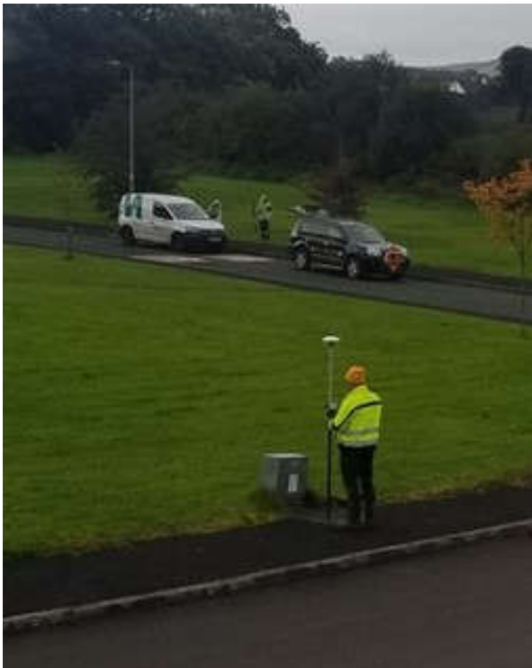
Oibreacha suirbhé topagrafacha, Ráth Mealtain Deireadh Fómhair 2021

Cuireadh na réamhsuirbhéanna suímh go léir i gcrích i mí Dheireadh Fómhair. Cuirfear torthaí na suirbhéanna agus na staidéir dheisce sin i dtoll a chéile ina dtuairisc srianta comhshaoil, tuairisc a chuideoidh scéim a leagan amach atá inghlactha.