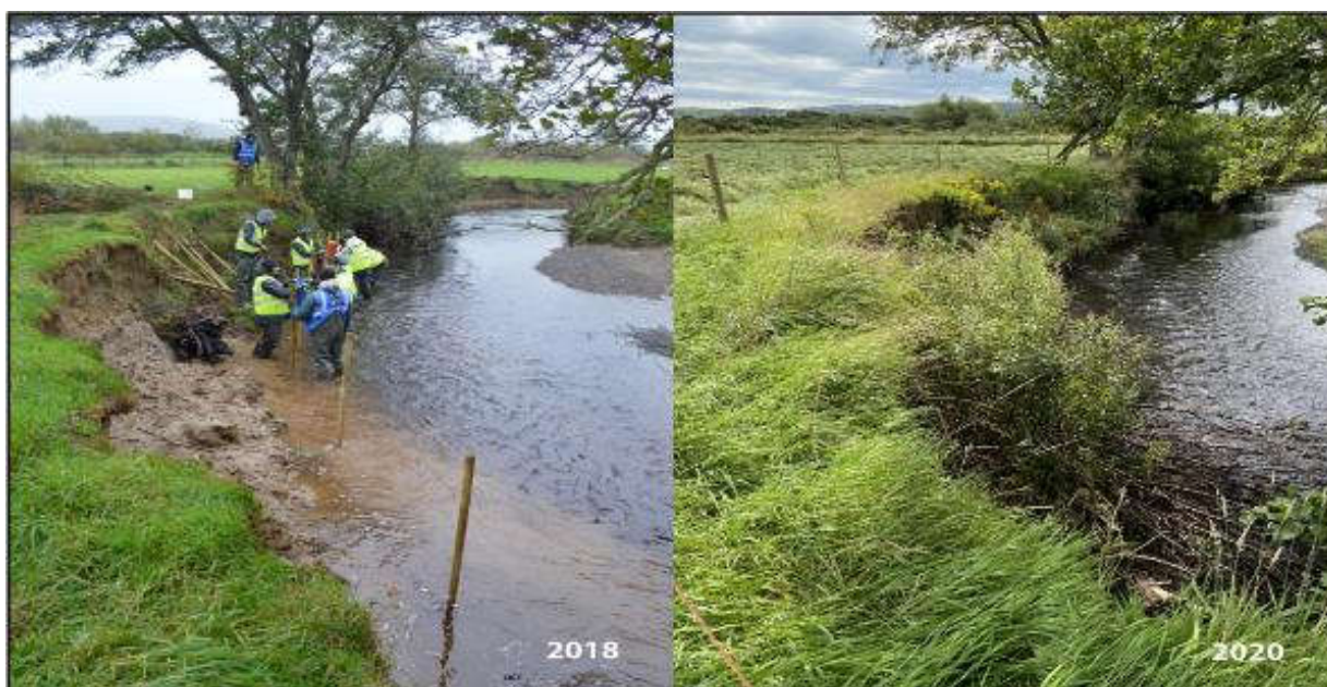
Sampla de bhainistiú dríodair ar Abhainn Glenagannon, Inis Eoghain

Tá méasúnú ar siúl faoi láthair ar bhearta féideartha le hUisce Nádúrtha a Choinneáil le baol tuilte a mhaolú i ndobharcheantair. Mar thús, beidh trí chineál léarscáile ann ag an fhoireann tionscadail do 1) Laghdú ar Rith Chun Srutha, 2) Stóráil agus 3) Úsáid Talaimh / Bainistiú Dríodair. Beidh staidéar indéantachta iomlán ann mar thoradh ar an léarscáiliú fosta.