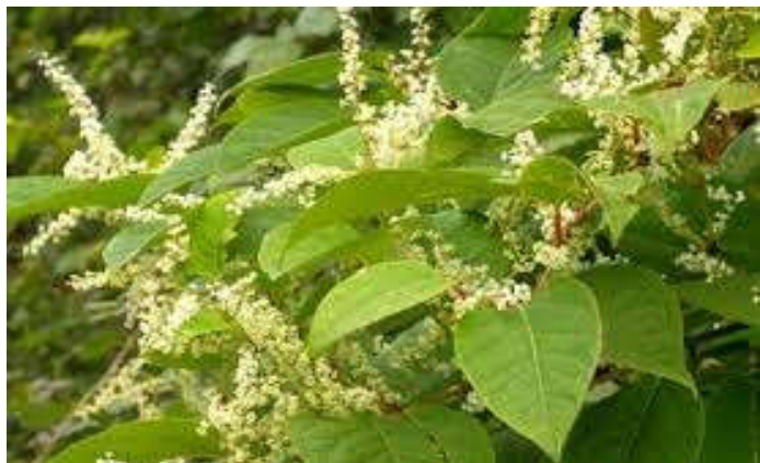
Tá Glúineach Bhiorach i Ráth Mealtain