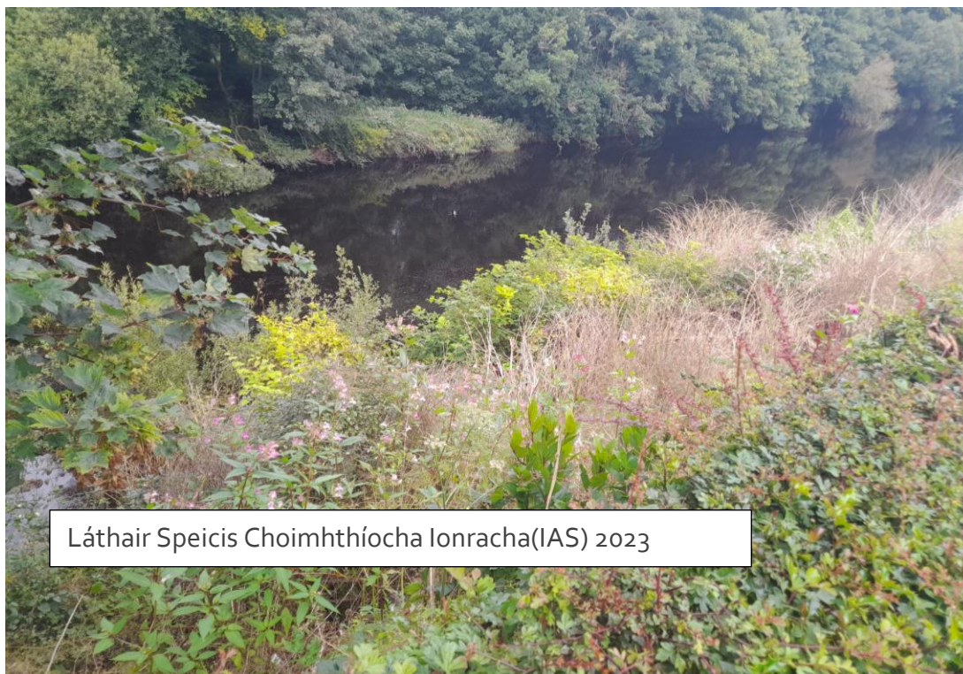
Láthair Speicis Choimhthíocha Ionracha(IAS) 2023

Nuair a thiocfaidh an rogha is fearr chun solais, rachaidh measúnú scóipe do shainsuirbhéireacht timpeallachta ar aghaidh, lena n-áirítear torann agus creathadh, cáilíocht an aeir, agus an tírdhreach agus gnéithe amhairc.